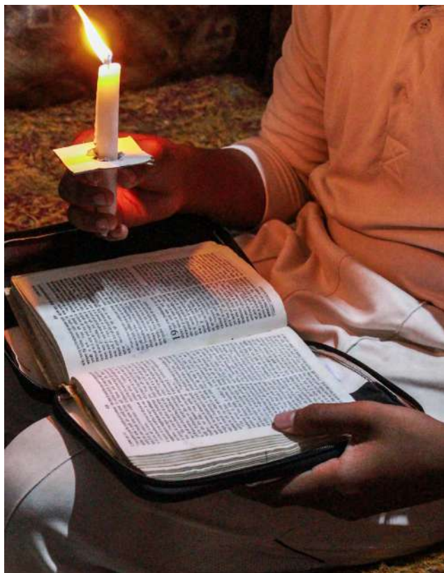
En India, un niño sostiene una vela y lee la Biblia.

Los niños y los jóvenes siguen enfrentándose a formas específicas e intensas de persecución y discriminación a causa de sus identidades de creencias, de forma coherente con las conclusiones preliminares del informe de 2021 sobre la persecución religiosa específica de niños y jóvenes. 6