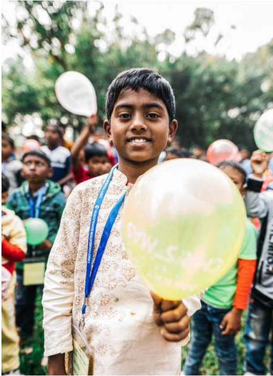
Christmas celebrations in Bangladesh for believers from Muslim backgrounds.

En una etapa formativa de la vida y del desarrollo de la fe, los niños y jóvenes se enfrentan a formas de persecución sorprendentemente duras. El uso del matrimonio forzado, el secuestro y el reclutamiento forzoso como niños soldados en milicias o