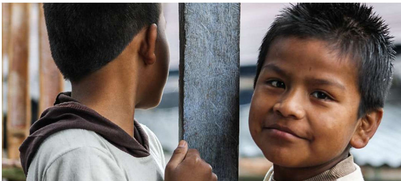
Niños indígenas de la comunidad Nasa de la región del Huila cuyos padres han sido desplazados por las autoridades por su fe.

En el ámbito comunitario, la presión es especialmente alta para los niños y jóvenes cristianos de origen indígena . En estos contextos, la conversión se castiga severamente, y las familias cristianas se convierten inmediatamente en ciudadanos de segunda clase.