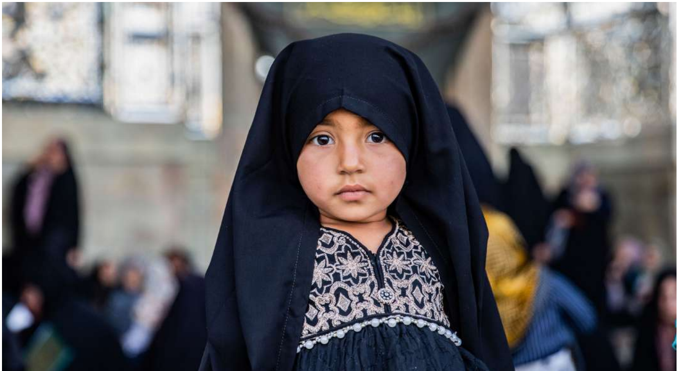
Una joven iraní cerca del santuario de Fátima Masumeh en Qom, Irán.

Esto refleja el poder de los miembros de la familia sobre los niños y los jóvenes , y constituye una de las formas más extremas de aislamiento, en la que el contacto con los amigos y los compañeros cristianos se corta por completo.