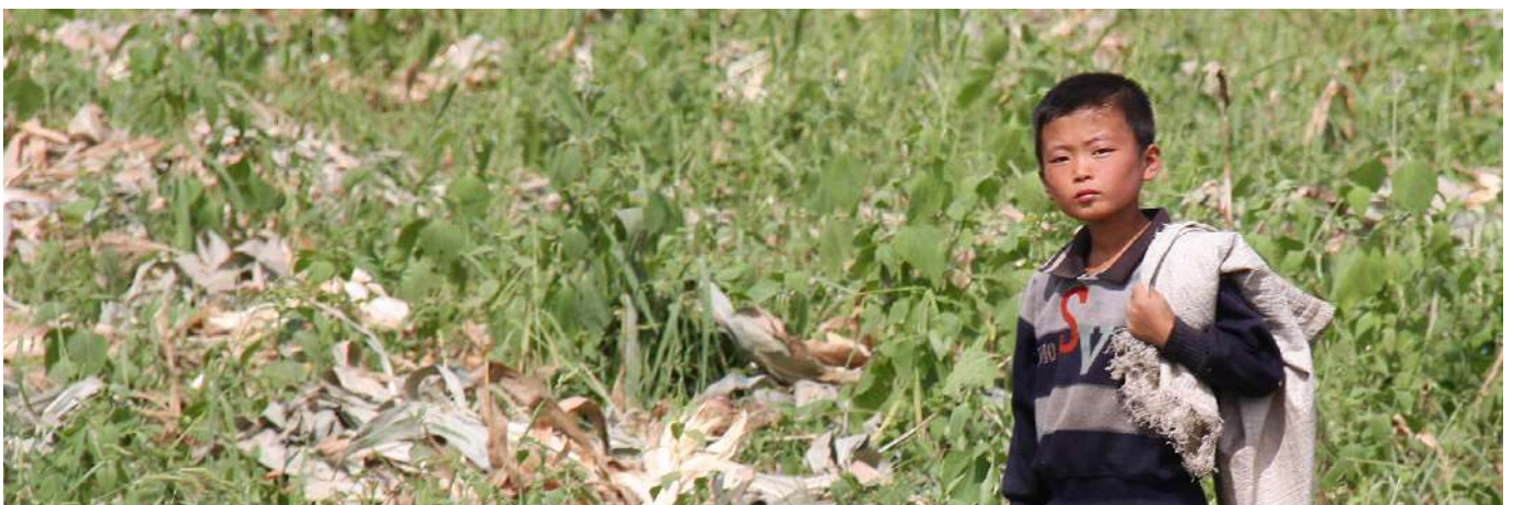
Un joven en los campos cerca de Kaesong en Corea del Norte.

Una versión más detallada de la metodología con un esquema del marco de puntos de presión del PRE para niños y jóvenes con sus definiciones puede encontrarse en Open Doors Analytical . 61